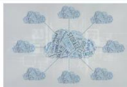
Software e Aplicações Remotas (SPSS)