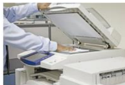
Sistema de Impressão