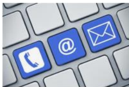
Helpdesk - Suporte