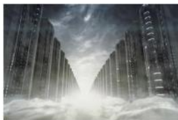
Mapa de Software