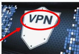
Virtual Private Network