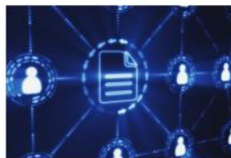
Áreas de Rede