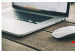
Rede sem Fios