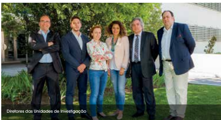
Diretores das Unidades de Investigação

que foi, inclusive cofundador; no Centro de Estudos Transdisciplinares para o Desenvolvimento (CETRAD; UID/SOC/4011), onde assume a coordenação do Grupo de Turismo; no Centro de Psicologia da Universidade do Porto (CPUP; UID/PSI/0050); e no Centro de Investigação em Artes e Comunicação (CIAC; UID/ARTE/4019). As duas primeiras unidades obtiveram a classificação de Very Good e as restantes com Excellent e Good, respetivamente (avaliação internacional promovida pela FCT/ 2014).