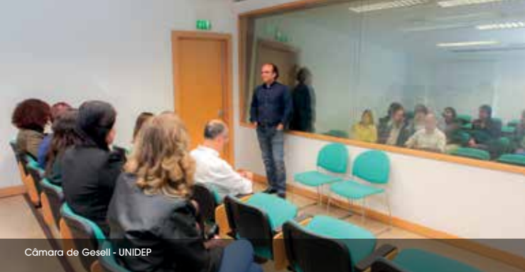
Câmara de Gesell - UNIDEP