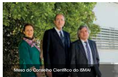
Mesa do Conselho Científico do ISMAI