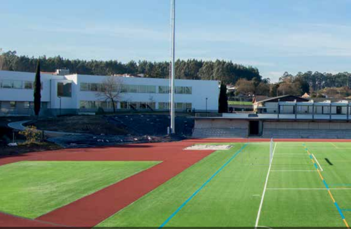
Panorâmica do Complexo Desportivo