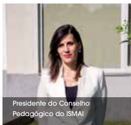
Presidente do Conselho Pedagógico do ISMAI