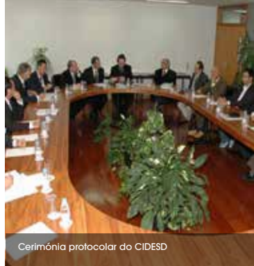
Cerimónia protocolar do CIDESD