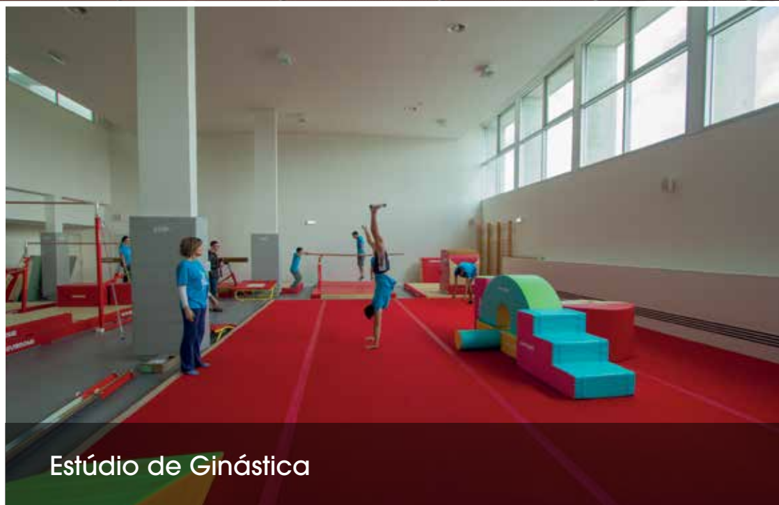
Estúdio de Ginástica