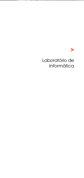
Laboratório de Informática