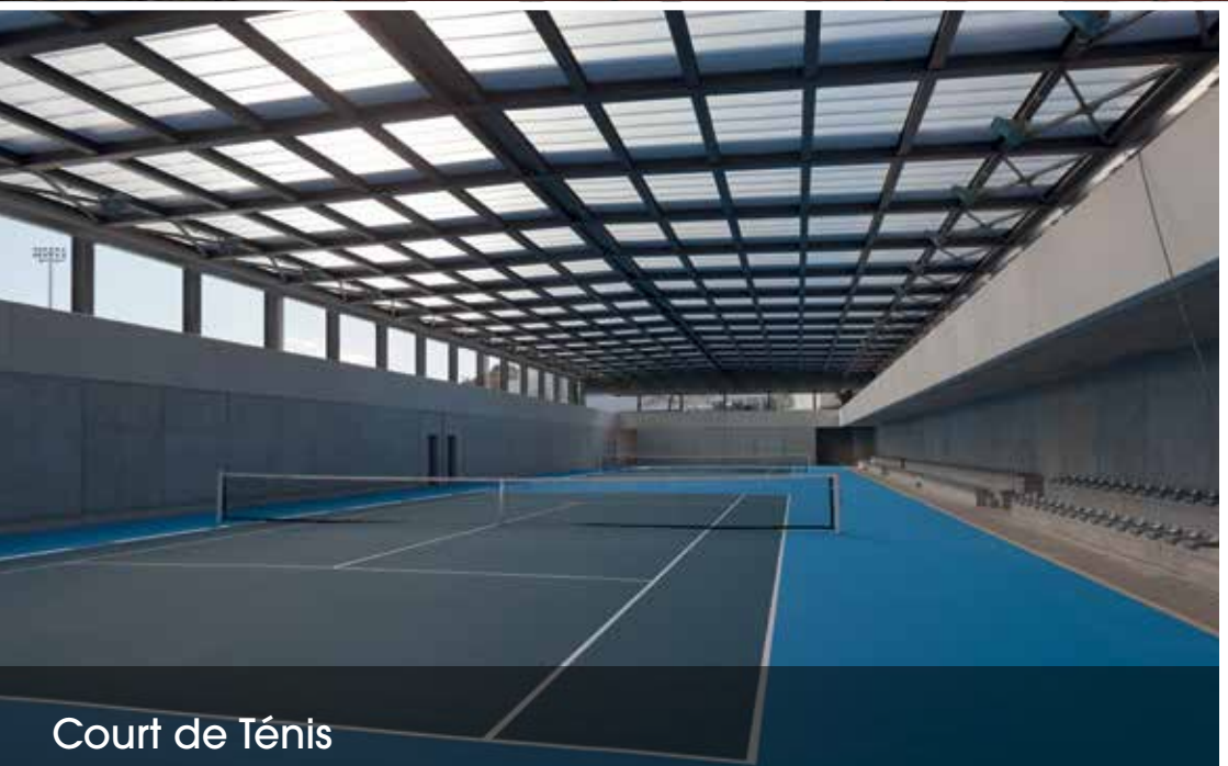
Court de Tênis