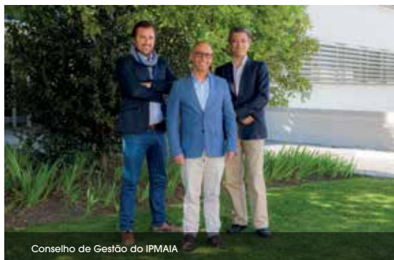
Conselho de Gestão do IPMAIA