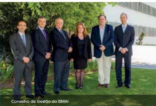
Conselho de Gestão do ISMAI

O autónomo projeto científico, pedagógico e cultural do Instituto Politécnico da Maia – IPMAIA consubstancia-se através de duas unidades orgânicas permanentes: a Escola Superior de Tecnologia e Gestão e a Escola Superior de Ciências Sociais, Educação e Desporto. Neste, as unidades funcionais departamentais e as unidades permanentes transdepartamentais e ainda as funcionais não permanentes estão dependentes da Direção da Maiêutica, que se obriga a assegurar uma gestão de espaços, recursos humanos e equipamentos, em função das circunstâncias e das prioridades associadas aos interesses institucionais.