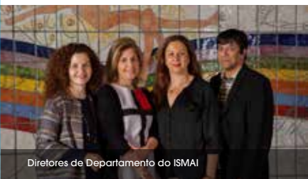
Diretores de Departamento do ISMAI